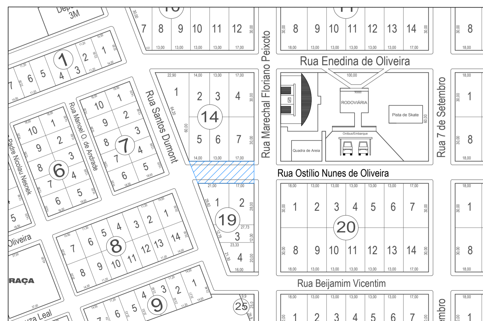
LOCAL DE INTERVENÇÃO Escala 1:2500