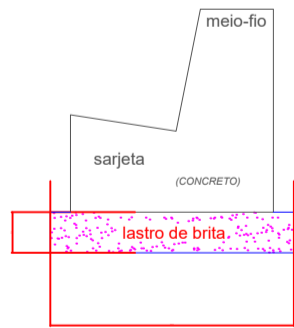
Secção Transversal Tipo escala 1:10