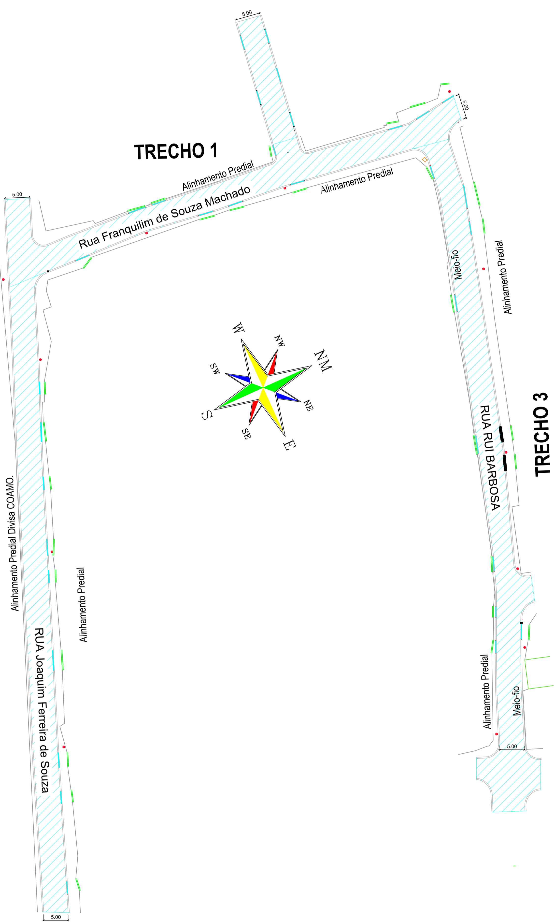
Planta da Pavimentação Asfáltica Escala 1:500