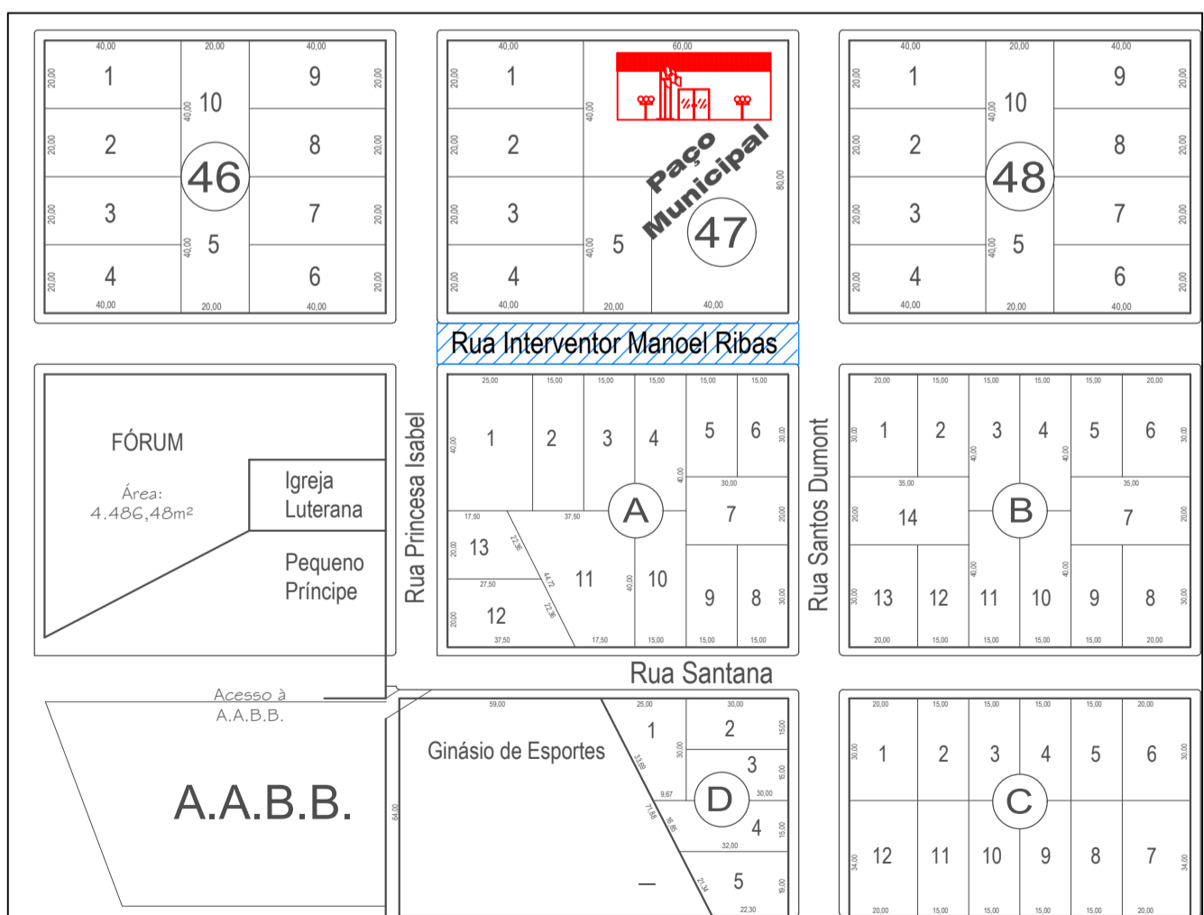
LOCAL DE INTERVENÇÃO Escala 1:5000